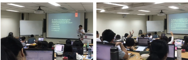
學生進行多元評量過程